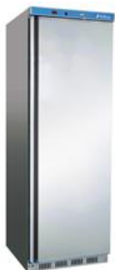
Frio Comercial - Armarios refrigerados en ABS - Armarios mantenimiento de congelados